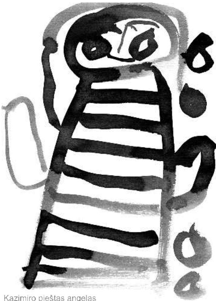
Kazimiro pieštas angelas

Stebuklai būna tik su angelais iš dangaus ( Aurimas )